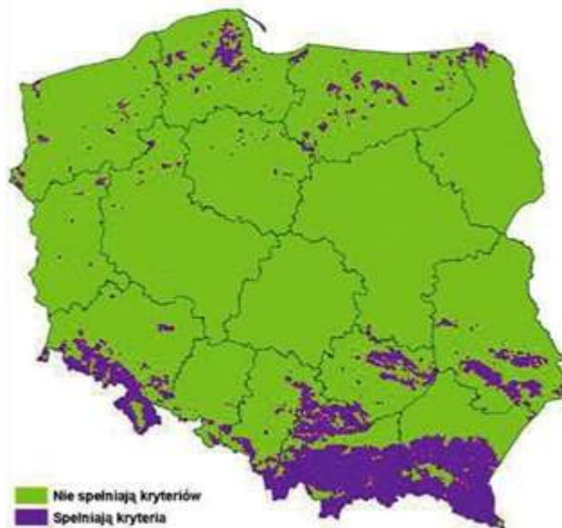
Ryc. 1. Wykaz obszarów zagrożonych erozją wodną